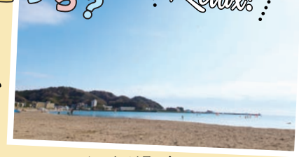
ワイワイ楽しめるビーチ