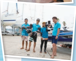
↑フライフィールド逗子のスタッフと。毎日お互いに刺激し合える、大切な仲間たちだそう